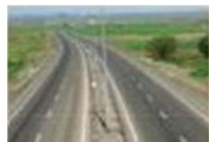
احداث آزاد راه : ۱۰ کیلومتر روکش آزاد راه: ۱۵۹ کیلومتر