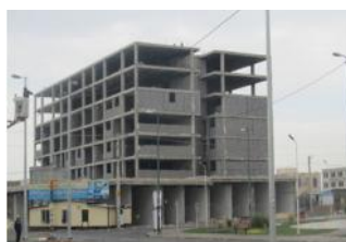
انجام پروژه های مشارکتی مسکونی - تجاری در شهرهای بالا ( ۲۵۰۰۰ نفر) ساوه و اراک به متر از ۲۴۶۶۰ مترمربع - مطالعه و طراحی پروژه های مشارکتی اراک به متر از ۲۱۶۴۸ مترمربع