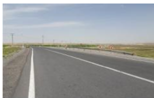
احداث راه روستایی : ۱۵۵ کیلومتر روکش راه فرعی و روستایی: ۹۳ کیلومتر