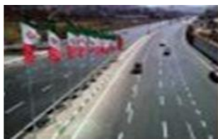
احداث بزرگراه و راه اصلی : ۱۶۷ کیلومتر روکش بزرگراه و راه اصلی: ۲۳۷ کیلومتر