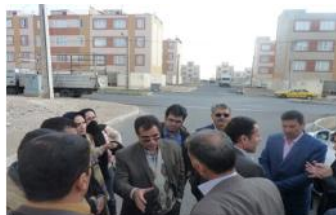
آماده سازی ۱۳۰ هکتار اراضی استان - نظارت عالیه ۵۶۸۰۰۰ مترمربع ساخت و ساز های استان