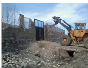
رفع تصرفات دولتی : ۴۷۲ هکتار احداث ساختمانها، و تاسیسات عمومی و دولتی شامل بیمارستان و مجتمع فرهنگی و هنری و ... اخذ سند تک برگی : ۲۹۵۰ عدد قرارداد های اجاره عرضه : ۲۳۵۰ عدد - اسناد دریافتی : ۴۵ عدد