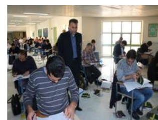
۶۳۰۰۰ نفر ساعت آموزش مهندسين نظام مهندسی - صدور و تمدید ۶۰۰۰ فقره پروانه حقوقی و حقیقی